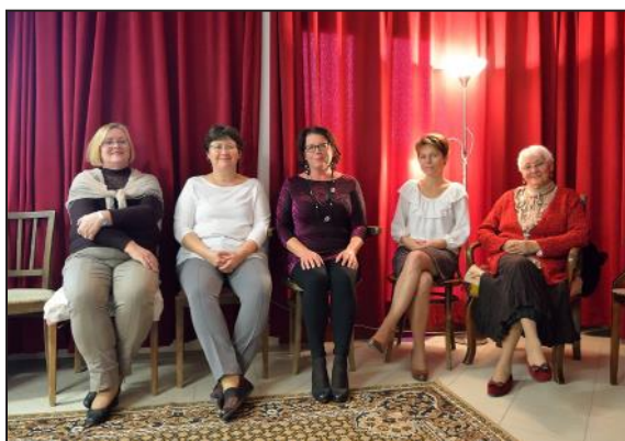
a „Női lapozók”

„Az én kiállításom” sorozat „Foglaljon helyet” című eseményének főszereplői ez alkalommal kedvenc székeink voltak. A Női lapozó tagjai és mi, a