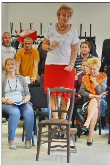
a Bokrétaék

együtt voltunk, gyerekzsivaj és a jókedv hangjai töltötték be a Faluház környékét. Újra eltölthetett bennünket az érzés, hogy milyen jó ezen a szép helyen élni! Köszönöm a Női lapozó és Fejes Andrea kedves meghívását erre az eseményre!