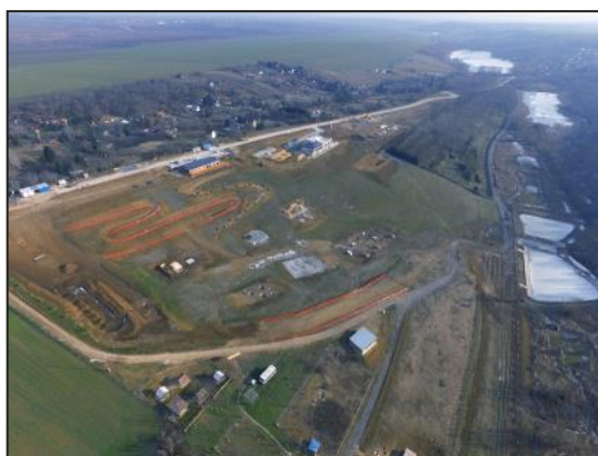
Az élménypark fentről