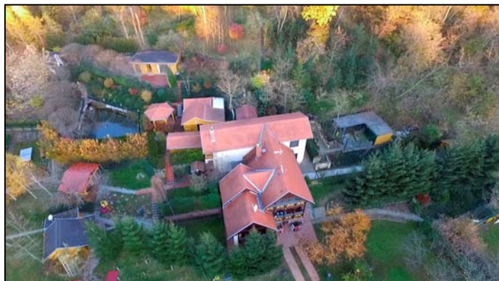
A Petri-kert fentről