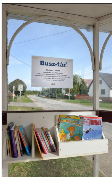
Fotó és szöveg: Róder Attila

Szociológiai kísérletnek is felfogható érdekes kezdeményezéssel találkozunk októbertől a Pécs-Pogány között közlekedő autóbuszok utasai. A pogányi buszmegállókban minikönyvtár található, ahol folyóiratok és könyvek között válogathatnak az utasok. A könyvek, újságok elvihetők, a buszon töltött idő alatt olvashatják. A Pogányi Könyvtár kezdeményezésére létrejött „Busz-tár” példaértékű lehet. Reméljük, hogy a könyveket, újságokat csak az elhasználódás miatt kell majd pótolni, cserélni.