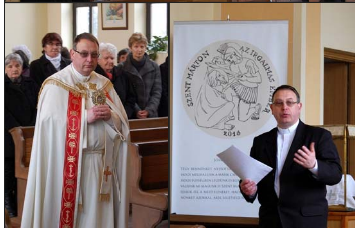
Az ereklje érkezése