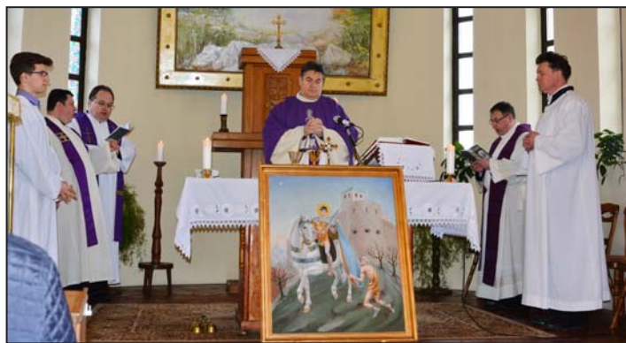
A szentmise celebránsai...