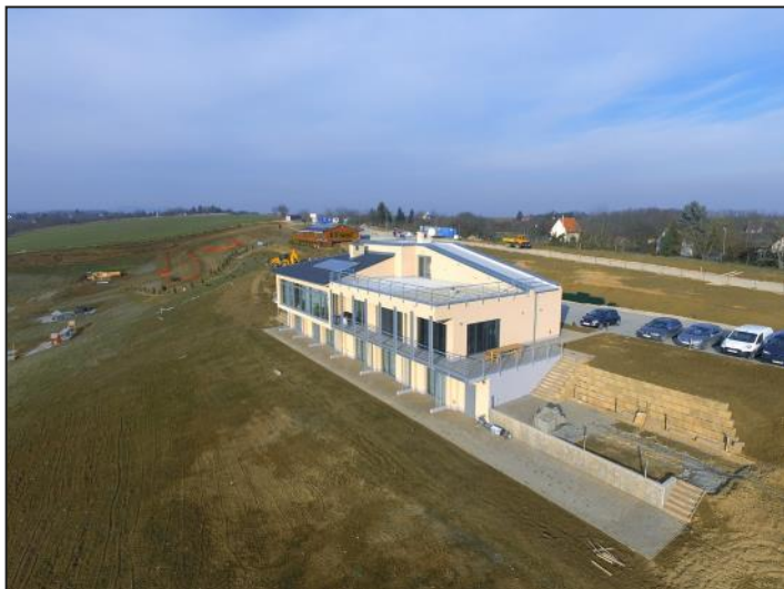
A hotel madártávlatból fent, és a hotel egyik szobája és fürdője lent

park pedig március 15- én fog nyitni. A 23 hektáros területet „Zsályaliget”-nek neveztük el és a hotel is a „Zsálya” nevet