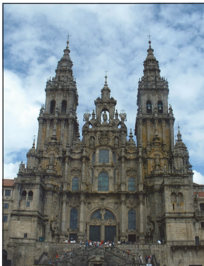
A Szent Jakab-katedrális

Szent Jakab holttestét hajón, Jeruzsálemből Észak-Spanyolországba hozták, majd eltemették ott, ahol most Santiago de Compostela található. Több útvonal is létezik: így az Angol-, az Ezüst-, az Északi-, a Francia-, vagy a Szent Jakab nevet viselő. A legnépszerűbb, a Saint-Jean-Pied-de-Port-ból induló francia út, 780 kilométer hosszú, és a Pireneusokon való átkelés után, négy nagyobb spanyol várost, Pamplonát, Logronot, Burgost, Leónt érinti. Egyéni utak is tervezhetők, de közös bennük, hogy mindegyikük Santiago de Compostela városába vezet.