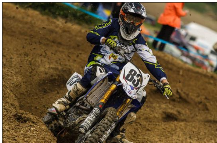
Verseny közben Gergely...

- 2013-ban, az Mx2B-ben, a kezdők kategóriájában – aminek viccesen „daráló” a neve – indultam 83-as rajtszámmal, 250-es yzf Yamahával. Sokan voltunk, nem is tudom hányadik lettem.