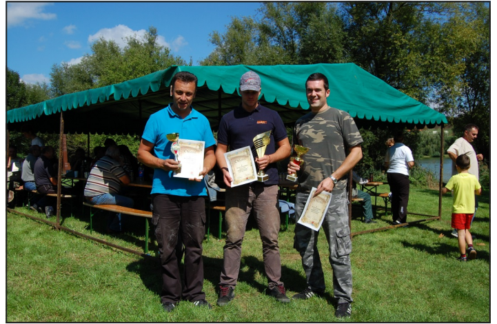
A Koch Valéria Iskolaközpont győztes csapata