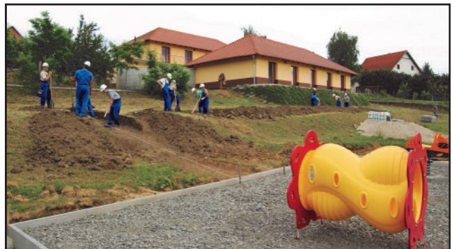
Szöveg és fotó: Pálmai Tibor

A Faluház mögötti önkormányzati telken pályázati pénzből új játszótér készül a pogányi gyermekek részére. A korszerű játszótéri elemeket a kivitelező már elhelyezte. Jelenleg a terület aljzatát a Falugondnokság a közmunkások segítségével készíti. A játszótérre vezető járda földmunkáit a Pécsi Pollack Mihály Műszaki Szakközépiskola 9. évfolyamos építész technikus tanulói (a képen) a nyári szakmai gyakorlatuk keretében végzik.