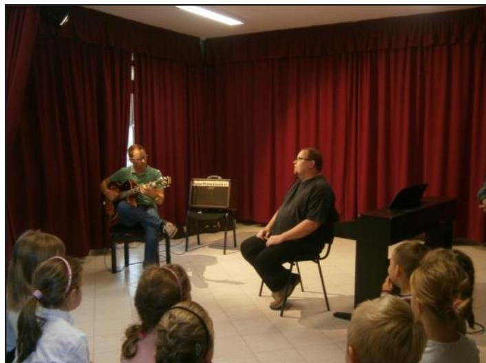
A Semjén testvérek zenélnék

zene technikai tudásában, hogy a muzikalitás a legegyszerűbb kis daltól a virtuóz hegedűjátékig mindenhol érezhető, hallható, átadható. Ahogy a tavaszi Költészet napi helyi kulturális esemény, úgy ez a kis házi muzsikálás is hangulatos és méltó