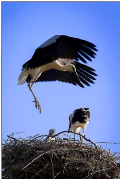
A különdíjat nyert kép

A Duna-Dráva Nemzeti Park által meghirdetett Fekete István fotópályázaton a pogányi fotóklub három tagja is helyezést ért el: