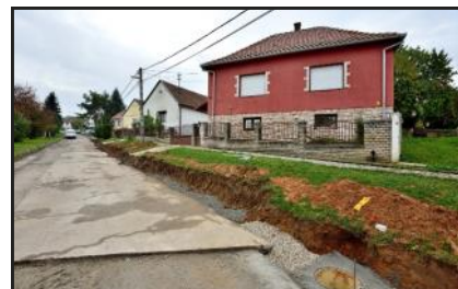
Kép és szöveg: Róder Attila

A Kossuth L. utcában a szivárgó talajvíz elvezetését oldja meg a kivitelező. A munkák hamarosan befejeződnek, ezzel megoldódik a több éve fennálló, az úttesten időszakosan átfolyó víz okozta probléma.