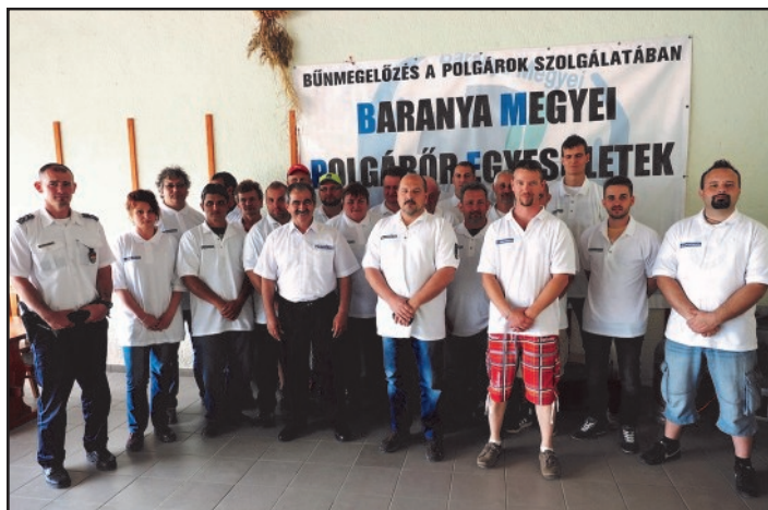
A Pogány Biztonságáért Polgárőr Egyesület tagjai

Az egyesületnek van lehetősége arra, hogy lakossági támogatást fogadjon el legálisan. Minden forint segítség, ezért nem is említék összecszerűséget. Munkánkat minden visszajelzés segíti, legyen az pozitív vagy negatív, nekünk hasznunkra fog válni. Kezdeti tapasztalataim a működéssel kapcsolatban kielégítőek. Ez a tevékenység sok figyelmet igényel, de örömteli pillanatokban is van részünk. Külön örömmre