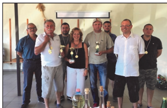
A pálinka verseny díjazottjai

Az eddigi hagyományoktól eltérően, ugyanazon a napon és helyen került megrendezésre a Pogányi Pálinka- és Stifolder verseny. 2015. június 6-án, a Nyárfás presszó teraszán gyűlt össze a zsűri, a versenyzők és a szépszámú érdeklődő közönség.