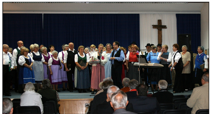
Minden szereplő a színpadon

A Vukovári Német Kultúra Estje záró epizódja tette még felejthetlenebbé az egész rendezvényt. Dara Mayer kérésére az összes szereplő egy kórusként énekelt az ide illő „So ein Tag”....(Csodálatos nap) című német dalt.