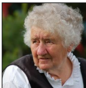
KATI NÉNI, Isten éltesse!

Hálával tartozom a sorsnak és köszönettel a Pogányi Német Nemzetiségi Önkormányzatnak, hogy megtisztelték a belépő-