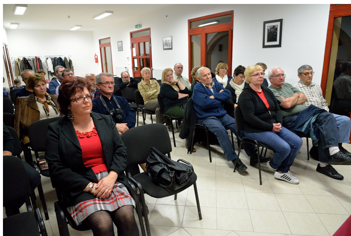
A „betelepült” hallgatóság