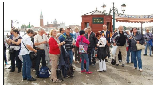
...és a csodálói

Canale Grande mentén álló több mint 100 palotát és templomot. Szabadidőnkben barangoltunk a kis utcákon, tereken, hidakon át, pizzáztunk, kávéztunk és