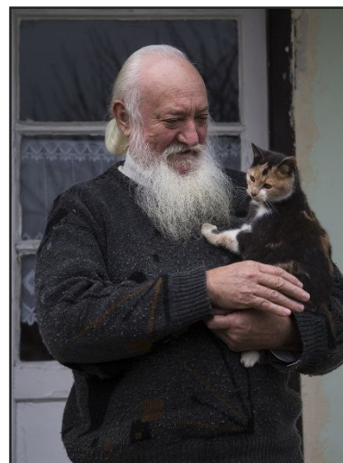
...és otthon. fotó: Baracs Dénes

A család emlékezetem óta itt lakott a faluban - kezdi Gyula a beszélgetést. A nagypapa boltos volt, a Muth Gyuri bácsi és a mama pedig a postás. Ez a saját ingatlanunkon volt. Édesanyám pedig később postai kézbesítő lett. 1986-ban elkerültem Pécsre, majd 2003-ban visszakérültem a faluba, és édesanyám halála óta egyedül élek. Nem érzem magam magányosnak, annak ellenére sem, hogy egyedül élek. Három éve nyugdíjas vagyok. Hajnalban korán ébredek. Ma négykor ébredtem és a TV-t néztem olyan 6 óráig. Miután kelek, a konyhai dolgokat végzem el, mivel minden rám hárul. Majd nekiállok a napi munkának. Főzni szoktam, de nem minden nap, nem rendelek ételt, mert a saját főztömet jobban szeretem és főzni is szeretek. Van két macskám, ezeken kívül senkiről sem kell gondoskodnom, de ezek eltartása is nagy felelősséggel jár, ezért nem tartok más állatot. Van az udvarban egy bekerített kertem, melybe veteményeket szoktam rakni. Ez nagyságában bőven megfelel, és a termények mennyiségéből még felesleg is marad. Persze ilyenkor a téli időszakban kicsit lassabban telik a nap, de amikor kitavasodik, akkor a kert szinte teljesen leköti. A Pécsi Bőrgyár Természetjáró Klubjának voltam az elnöke