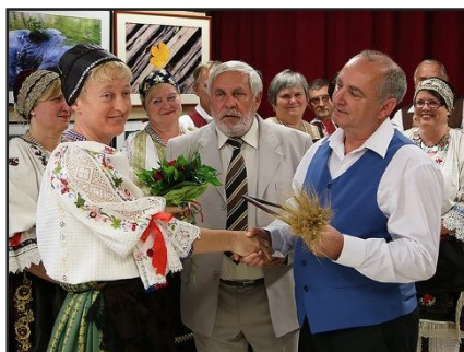
Fotó: Baracs Dénes

Május 17 –én a Faluházban, ünnepélyes keretek között