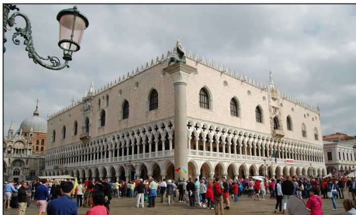
A Palazzo Ducale...

Az utazás első napján megkóstolhattuk a trojane óriásfánkakat, később Miksa főherceg trieszti kastélyában (Castello di Miramare) és az azt övező parkban sétáltunk. Szállásunk az olasz Adrián volt, Jesolóban. A kései érkezés sem riaszthatta el a tenger rajongóit a fürdözéstől.