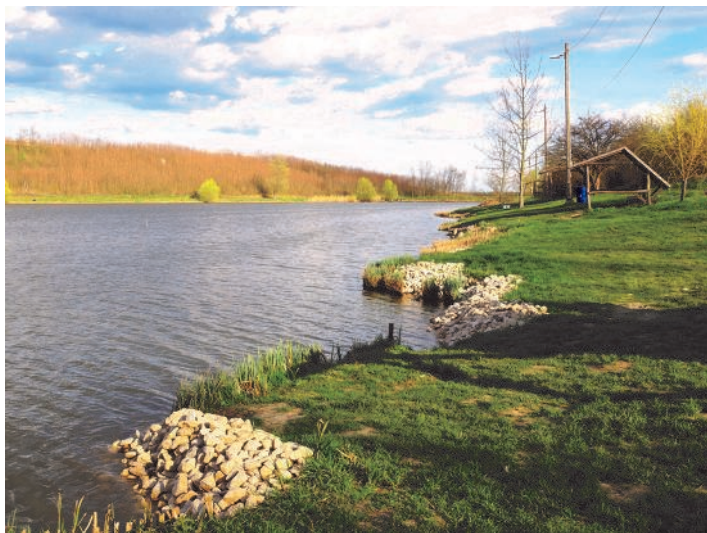
Megkezdődött a tópart rendbetétele.