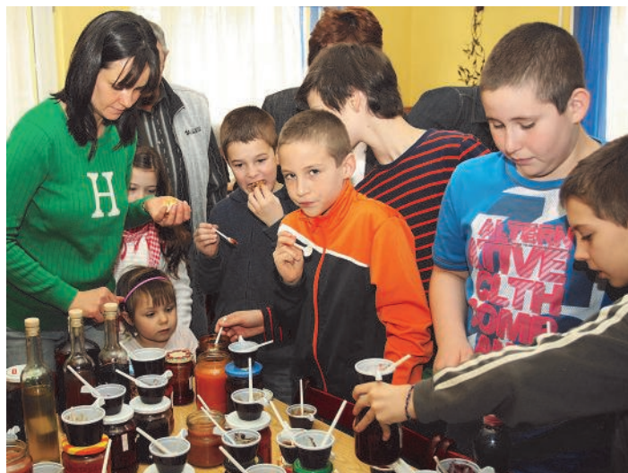
A bírálat után az igazi zsűri, a fogyasztók vették át a terepet.