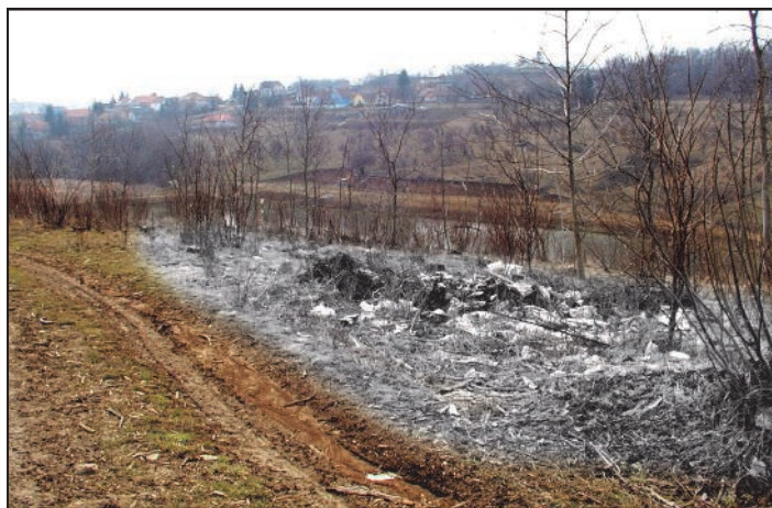
Illegális, már megszüntetett szemétkuckó Pogány határában.