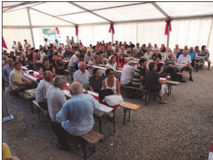
A községi rendezvények is alkalmasak arra, hogy megismerjük egymást.