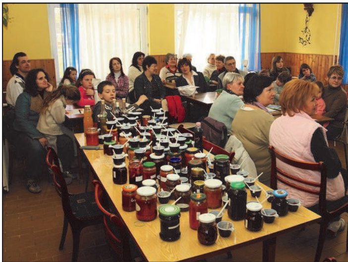
A résztvevők nagy figyelemmel kísérték a zsűri értékelését és eredményhirdetését.

Hagyományteremtő szándékkal rendeztük meg idén, első alkalommal, a lekvár- és szörpversenyt. Nagy érdeklődés övezte, rengeteg lekvárral neveztek a pogányiak, szám szerint ötvennyolc darab minta érkezett. Szörpből hat fajtát küldtek a versenyre. Nemcsak a hölgyek, hanem vállalkozó kedvű, kreatív urak lekvárjait is kóstolhattuk.