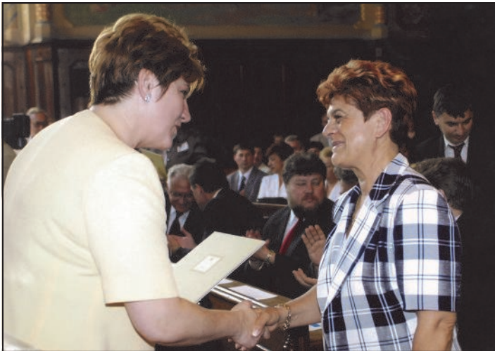
A címzetes főjegyzői kitiüntetést Lamperth Mónika belügyminiszter adta át 2004-ben.

Először csak helyettesítettem a szülési szabadságon lévő vb. titkárt, akkor jártam az egyetemre. Nagy kihívást jelentett számomra az akkori feladat, mely egyre összetettebb lett, így itt maradtam... Az emberek nagyon kedvesek voltak, tisztelték bennem az „írástudót”. Igaz, az akkori, tanácsai munka más volt, mint a mai önkormányzati, mert ha bárki hivatalos levelet kapott – és persze ezek már akkor sem voltak könnyen értelmezhetőek –, sietett hozzám a „tanácsba”, hogy magyarázzam el.