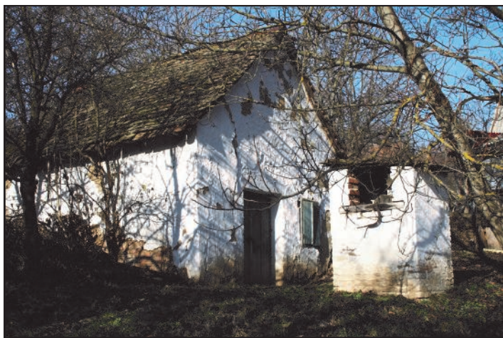
A Falucska dülő utolsó, régi időkből megmaradt présháza, akár dísz is lehetne a szőlőhegynak, amennyiben eredeti állapotában felújításra kerülhetne.

Sokan hálásak lehetünk Noénak, hogy bárkájának valamely szögletébe berakott egy szőlővesszőt is. Bizony e nélkül szegényebb és talán boldogtalanabb is lenne a világ. Mi, késői ivadékaik, nem hagytuk kárba veszni a megmentett növényt, és évezredek óta élvezzük annak nedűjét sokunk boldogságára ma is. Persze, hogy milyen a jó bor, azt nagyon nehéz megítélni, mert az ízlesek között bizony nagy különbségek vannak. A rossz bort azonban mindenki meg tudja ítélni rögtön. Egy dologban egyetértünk, nevezetesen, hogy a bor jó. Minden szőlőtermelő szereti, ha az általa előállított nedű mások elismerését is kivívja, amire jó alkalom a most már sok éve megrendezett pogányi borverseny. Nemrégiben végigjártam a szőlőhegyet, és bizony szomorúan tapasztaltam, hogy alig találni már olyan szőlőket, melyek valóban a bor előállítását szolgálnák, legalább a család részére.