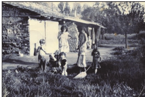
A régi téglagyár utolsó lakói

A téglagyár helyén az új tulajdonos nagyméretű földmunkát végeztetett el, ahol egy tó kialakításával amolyan látványparkot tervez létrehozni. Így került felszínre annak a pincének a bejárata, melynek kiásott földjéből számos elődünk otthona épült, és bizonyára még most is vannak olyanok ezek közül, melyeket napjainkban is laknak.