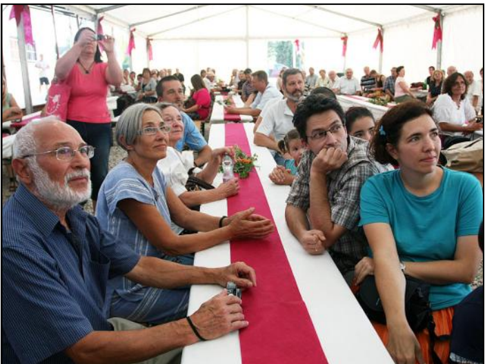
A bemutató résztvevői figyelemmel kísérik a beszélgetést.