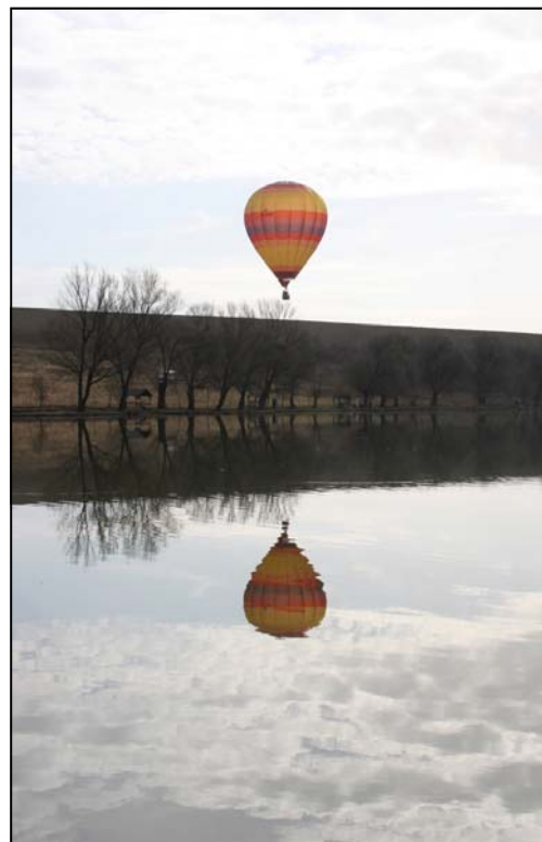
Kora reggel a tóparton.

A képviselőtestület magáénak érzi településünk minden gondját, és a lehetőségeket figyelembe véve meghozta a költségvetéssel kapcsolatos rendeletét. A részletes adatok a honlapon és a hirdetőkön megtalálhatóak, a főbb adatokat itt és a következő oldalon is közzé tesszük.