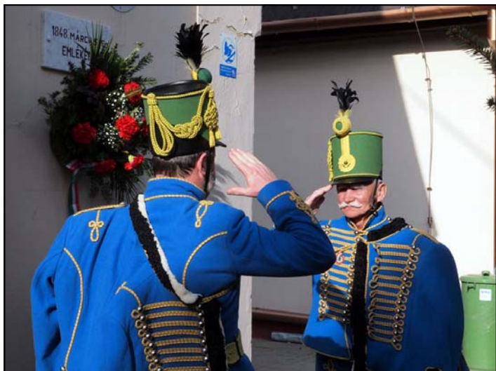
Koszorúzás március 15-én