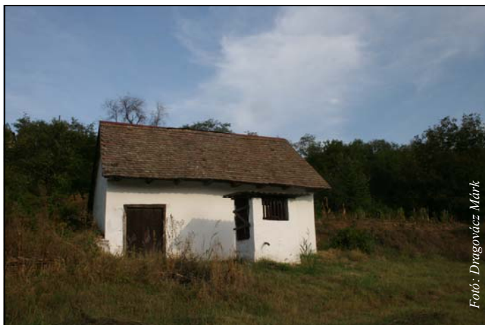
Egy régi "borkostoló" színhely a pogányi szőlőhegyen

Mint írják a kőkenyi borok jobb minőségűek voltak. /Ez is egy régi borverseny lehetne!/. Az 1857- 1860 közötti időszakban a feljegyzések szerint a faluban 106 ház szerepel és a szőlőhegyen 65 olyan gazdasági épület /présház, pince/ van, melyből arra lehet következtetni, hogy szőlőterület is tartozott hozzá. A bor minőségére nem található utalás de tudjuk, hogy az éves összmenyiség 10 802 akó bor volt az átlag pedig ezekben az években 981 akó.