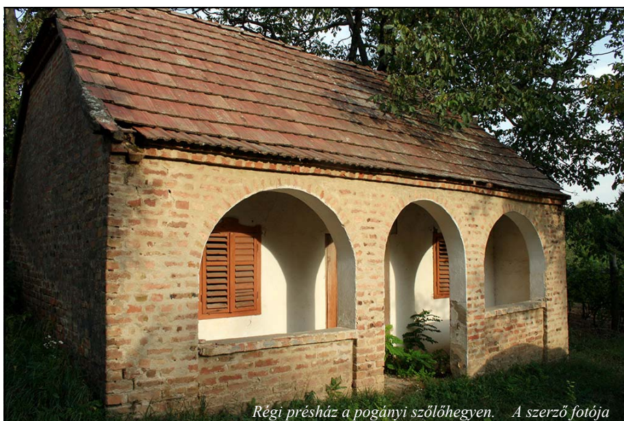
Régi prэшház a pórányi szőlőhegyen.

készültek. 1857-ben a faluban 106 ház volt és a szőlőhegyen 65 prэшház. A prэшházakhoz természetesen szőlő is tartozott. Az akkori adatok szerint átlagban 982 akó bor termett. Nem tudni ma mi a helyzet. Nincsenek ilyen adatok, de nézve a csodálatos tájat egyértelmű, hogy a szőlő kiszorult régi életteréről. Vannak még tőkék, melyek görcsösen kapaszkodnak a karóhoz, de többnyire csemegének való gyümölcsként élék meg életüket.