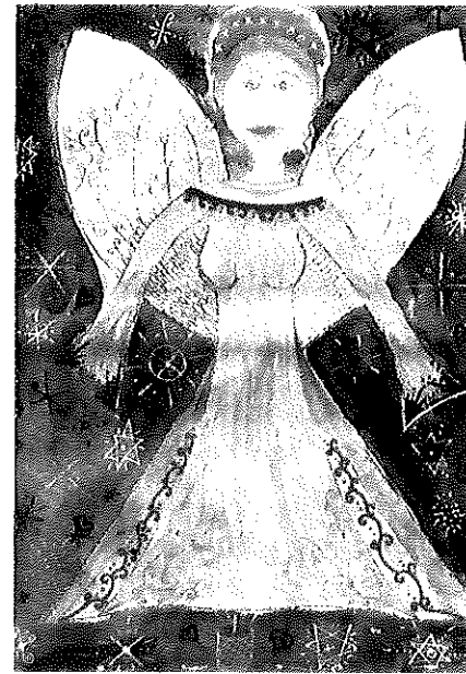
Hentes Vigh Panna rajza